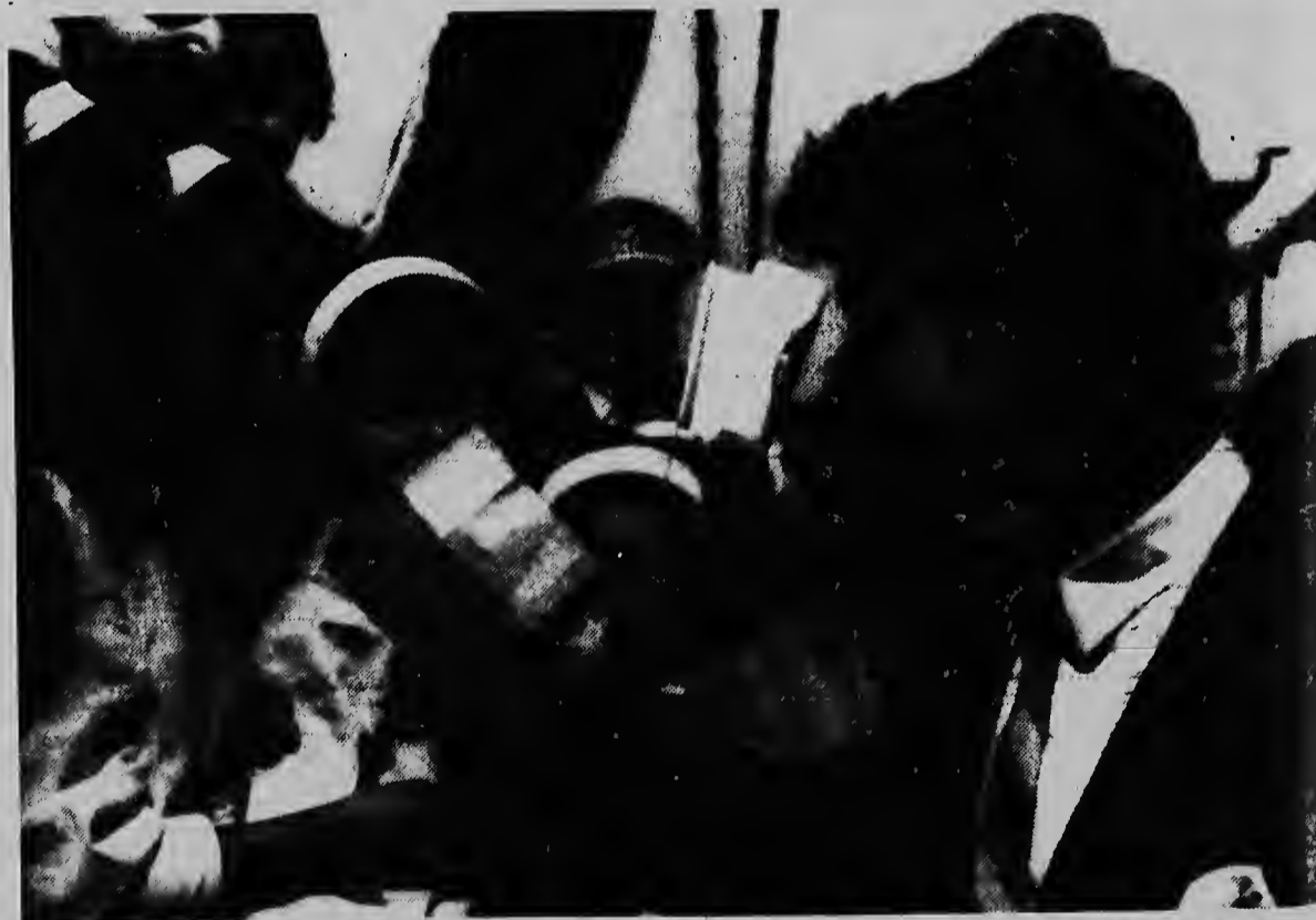
SANTIAGO, CHILE -- Senador Kennedy ta ser saluda pa muchanan na su yegada na pais aki. E senador di New York a tene un discurso y a priminti cu Merca lo hasi cambionan social na America Latina -.

As you stare into the vacuum of his eyes.